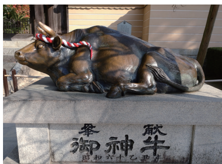
(左: 湯島天満宮、右: 大宰府天満宮)