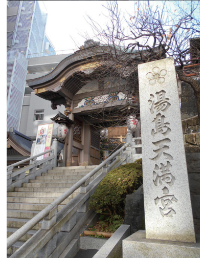
神社の入口 上は大宰府天満宮、下は湯島天満宮