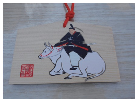
絵馬にも牛の絵が (湯島天満宮)