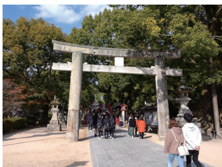
鳥居をくぐって (大宰府天満宮)

さて、お詣りには二礼二拍手一礼の作法が推奨されています。入口の鳥居をくぐる前に会釈をし、手水舎の水で心身を清めます。本殿まで進み、真心のしるしとして賽銭箱にお賽銭を静かに入れます。お辞儀を二回繰り返し、両手を開いて拍手を二回打ちます。ここを込めてお祈りした後、最後にもう一度お辞儀をします。