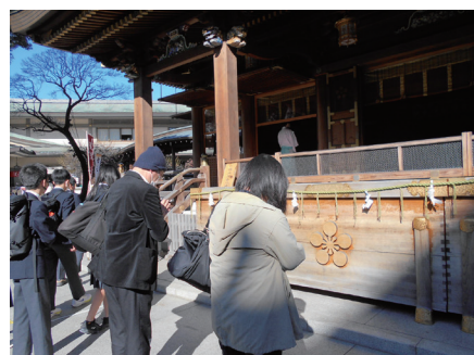
本殿でお祈り (湯島天満宮)