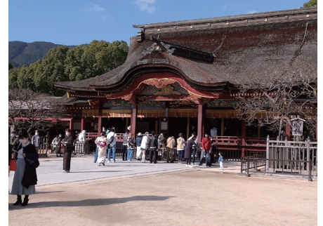
大宰府天満宮の本殿