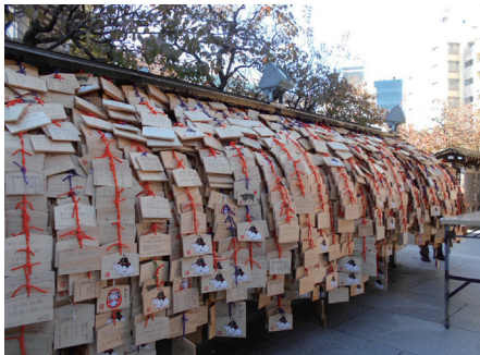
参詣者の願いの込められた絵馬が滝のように