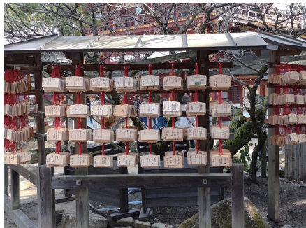
(左：湯島天満宮、右：大宰府天満宮)